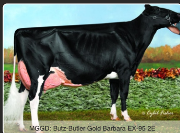
MGGD: Butz-Butler Gold Barbara EX-95 2E

SHOWTIME BARBIE! Anderledes showlinje Enestående 3,26 Type & +1991 Mælk