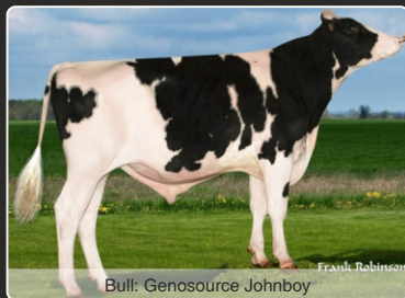
Bull: Genosource Johnboy

NY 9 Conf, +102 fedt & 85 Protein (Can) 157 RZG, 2796 GTPI & 3462 GLPI