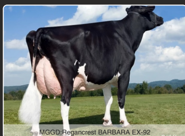
MGGD: Regancrest BARBARA EX-92

NY Nr. 1 type DOC søn. +914 mælk. SHOWTIME Barbie! 3,54 Type & 13 Conf